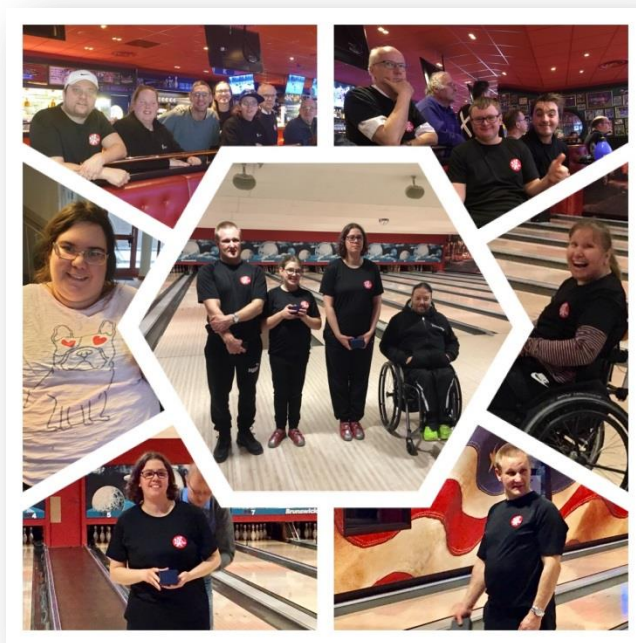
Deltagarbilder från Para DM

Tävlingsledningen kommer nu ta lärdom av sina erfarenheter och synpunkter på vad som kan förbättras inför nästa säsong för att utveckla arrangemanget ytterligare. Summa summarum vill vi i tävlingsledningen tacka för det beröm som gavs under dagen och i vill tacka alla deltagare, ledare och publik för att ni gjorde dagen så lyckad.