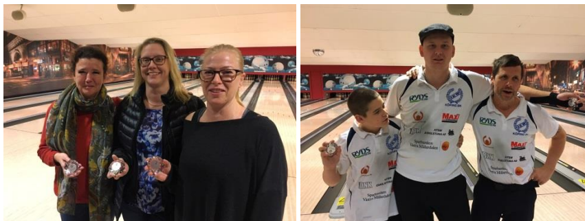
Segrande lag i 3-manna DM

Bägge tävlingarna spelades i Köping och det blev i 3-manna för herrar en total utklassning från IKW Köpings BKs sida som belade de tre topplaceringarna. På damsidan var det lika överlägset från BK Stjärnan.