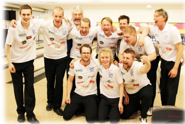
IKW/Köpings segrande lag i kvalet till Allsvenskan.