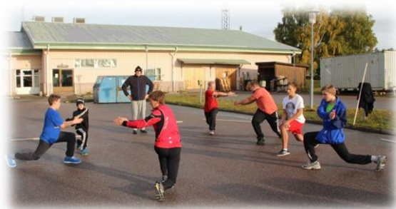
Bilden: Fysisk träning pågår utanför bowlinghallen i Sala.

Ungdomsverksamheten den gångna säsongen har främst fokuserats på Elitgruppen. Gruppen har genomfört ett antal läger med olika gästtränare.