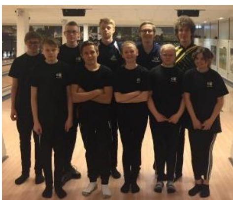
Gruppen i 1:a starten