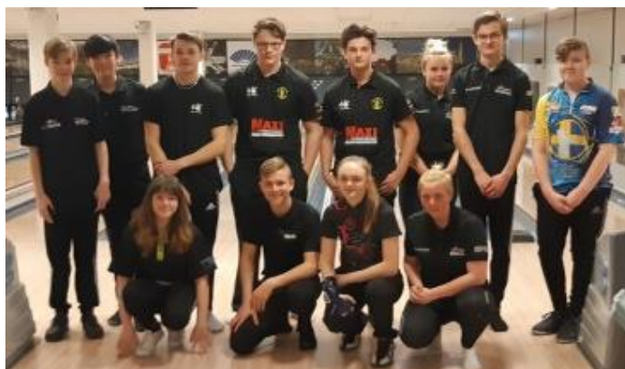
Gruppen i 2:a starten